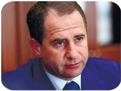
Михаил Викторович Бабич-Полномочный представитель Президента Российской Федерации в ПФО

«Это такая в моей практике первая попытка создать систему работы, когда мы не просто заплатили пособие, подарили какой-то подарок или оказали медицинскую помощь, а когда создается система непрерывного сопровождения людей для вовлечения их в активную, нормальную жизнь. Это крайне важная вещь, чтобы эти люди были максимально социализированы, чтобы они были просто частью общества — здоровой, нормальной частью общества — и чувствовали себя такими. Это даже не медицина, это больше, наверное, психология. Но чтобы эта психология работала, нужно создавать такие условия. Конечно, проект уникальный, экспериментальный, если хотите и очень важно из экспериментального сделать систему и тиражировать в регионах нашей страны»