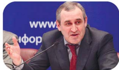
Сергей Иванович Неверов -заместитель председателя Государственной думы Федерального Собрания Российской Федерации

"Это уникальный проект. Очень важно, что есть такие неравнодушные люди, которые создают такие проекты. Сегодня государство может давать социальные контакты некоммерческим организациям, и очень важно пустить на этот рынок НКО, которые во многих случаях значительно эффективнее. Пример этому мы видим здесь, в «Доме Вероники». Ребята, судьбу которых я боюсь даже предположить, если бы они не оказались здесь, находятся сегодня в комфортных условиях, могут получить образование и работу. Мы обязательно на наших партийных площадках, в рамках нашей социальной платформы этот пример дополнительно рассмотрим и попробуем активизировать участие некоммерческого сектора в реализации таких проектов»