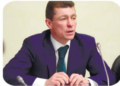
Максим Анатольевич Топилин Министр труда и социальной защиты Российской Федерации

"Вот просто люди, которые этим болеют, люди, которые сами придумали этот проект, которые им занимаются уже многие годы, за год смогли построить совершенно потрясающее, на мой взгляд, учреждение. Его нельзя назвать учреждением в юридическом смысле этого слова, но вместе с тем это вызывает просто восхищение и радость за то, что такое вообще может происходить. В Пензе удалось реализовать новый подход, предполагающий компактное проживание лиц с инвалидностью и их максимальное вовлечение в обычную жизнь. Действительно этот проект уникальный, я это подтверждаю. Пожалуй, это лучший опыт среди того, что я видел в стране» и тиражировать в регионах нашей страны»